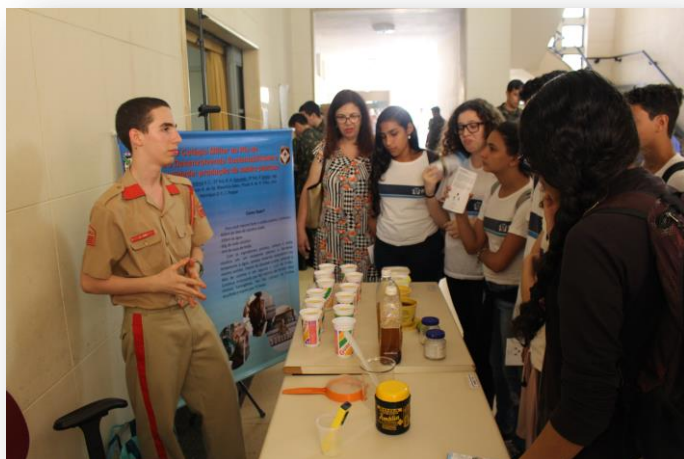
Alunos do CMRJ explicaram suas experiências científicas a Alunos de outras instituições de ensino.

Aos organizadores e aos participantes, parabéns pelo sucesso desse importante evento.