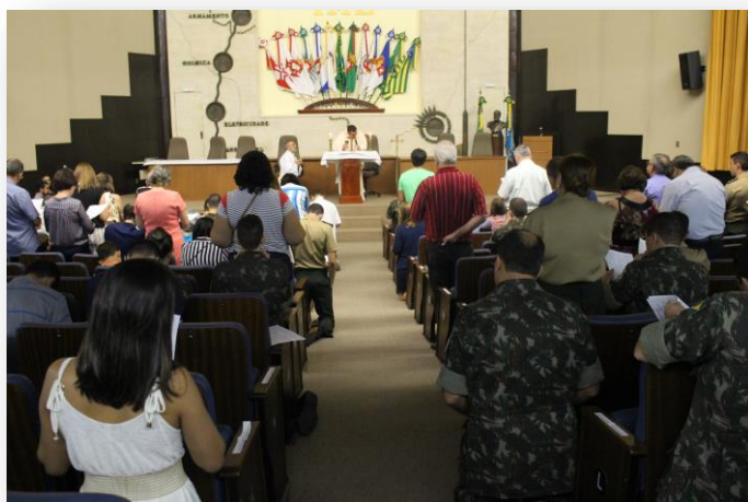
Missa em Ação de Graças