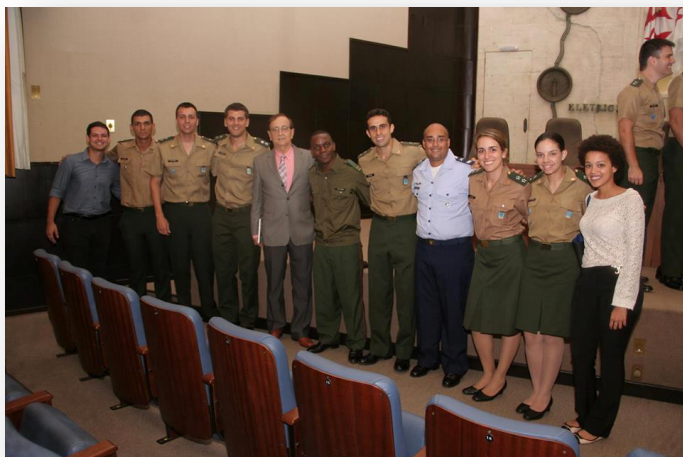
Entre os Formandos, um Oficial da Aeronáutica e outro do Exército de Moçambique.