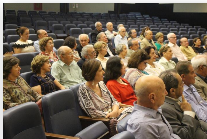
Familiares também prestigiaram esse momento muito especial.