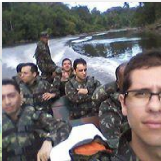
Alunos do IME em deslocamento para cumprir missão.

Na Região Amazônica, os deslocamentos são realizados utilizando-se a vasta rede fluvial.