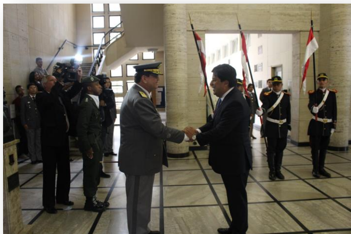
O General Barroso Magno apresentou as boas-vindas ao Ministro da Educação Mendonça Filho .