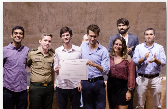
Equipe vencedora do concurso: originalidade, tecnologia, e muita criatividade a serviço da solução de problemas.

As Equipes demonstraram grande entusiasmo e motivação.