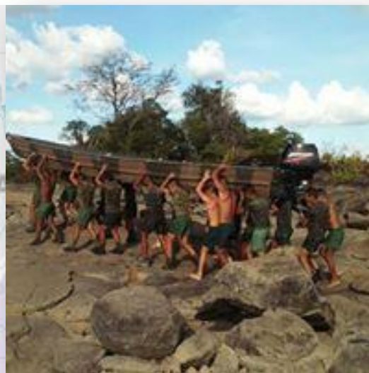
A união é capaz de superar qualquer obstáculo.