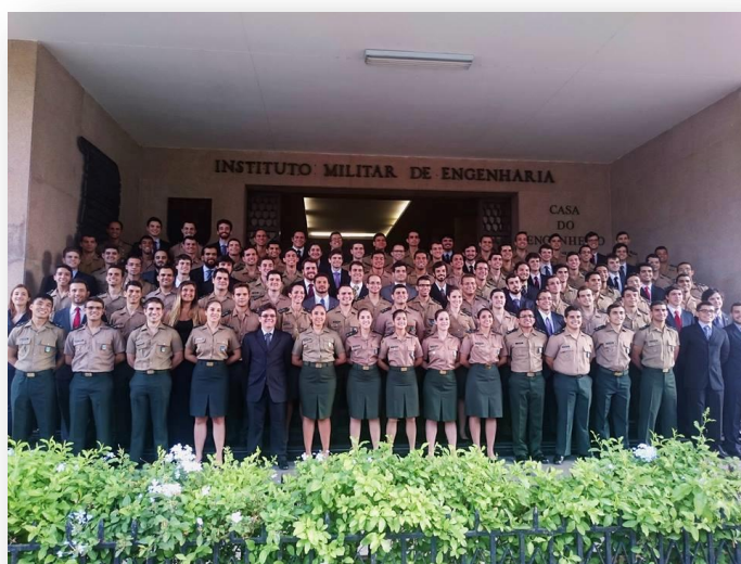
Turma do IME de 2015