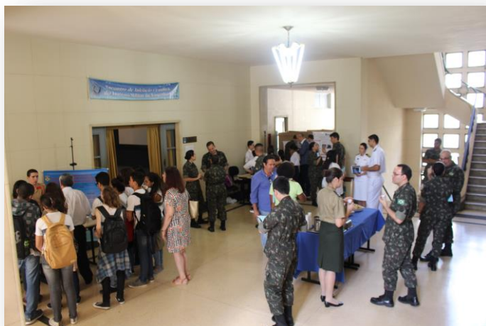
Participação efetiva de todos os presentes.

3. Feira de Ciências (FC): Exposição de trabalhos de Alunos do Colégio Militar do Rio de Janeiro (CMRJ);