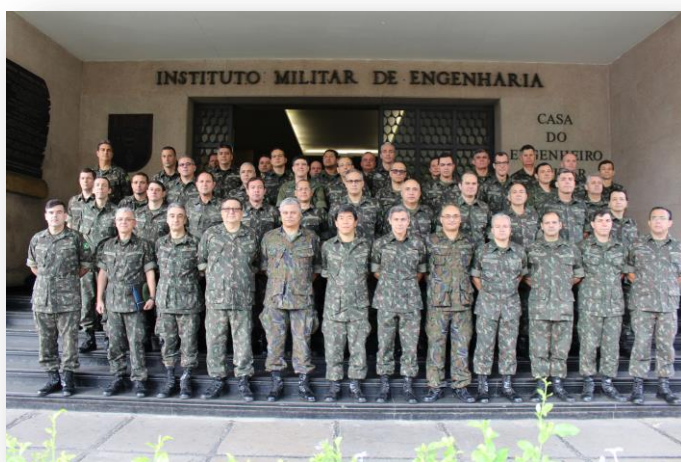
Os Oficiais do CPEAEx ao final da visita.

Nessa oportunidade, o Comandante do IME apresentou informações sobre as conquistas e os desafios institucionais na formação dos Engenheiros Militares do Exército Brasileiro.