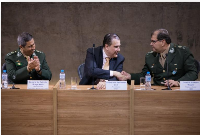
Momento dos cumprimentos institucionais IME & FGV.