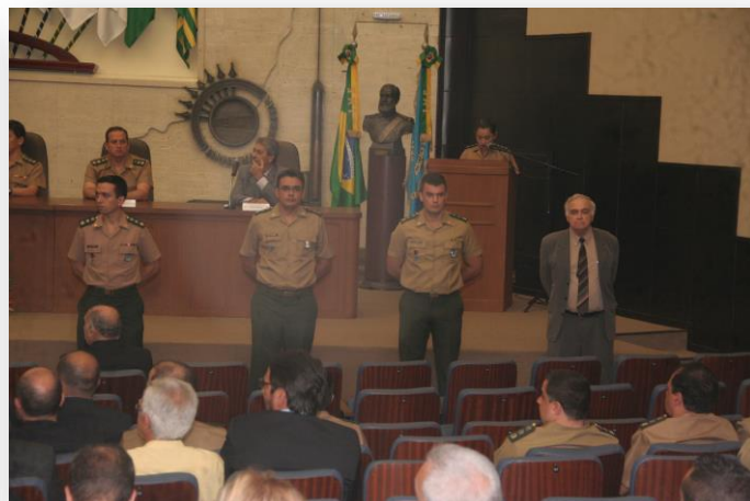
Os Paraninfos da Turma também foram homenageados pelos Alunos.