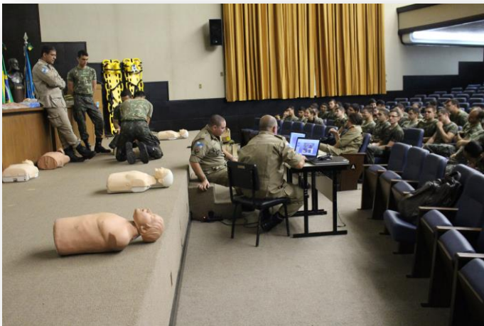
Prática das técnicas de salvamento.

Esse é um assunto de extrema importância, por sua aplicação em situações excepcionais, que exigem agilidade e técnica, na missão de salvar vidas.