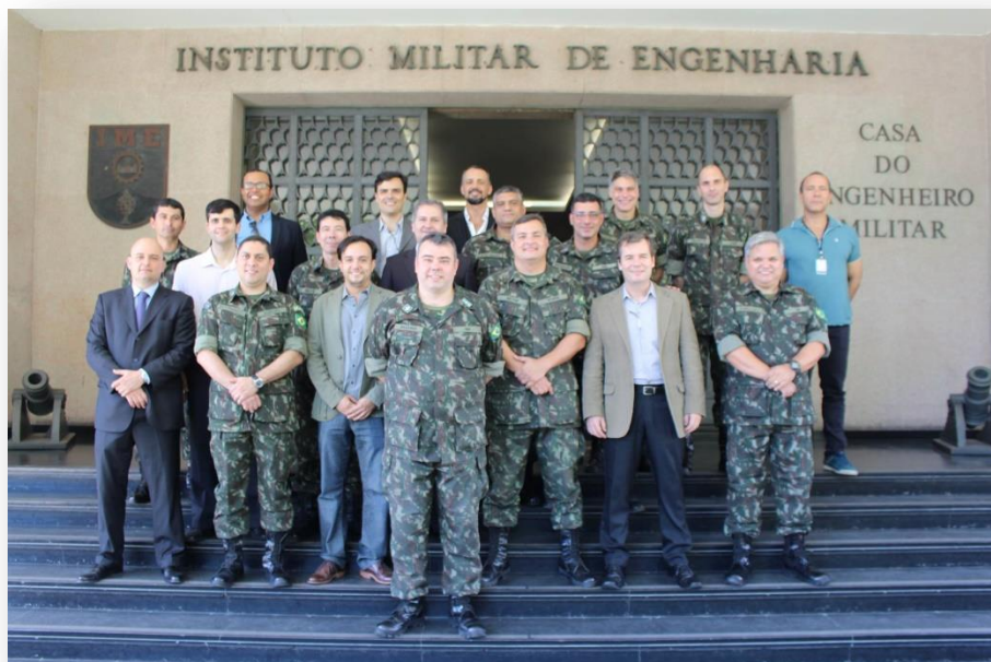
20 anos serviram apenas para aumentar a motivação e o orgulho de ser Engenheiro Militar...