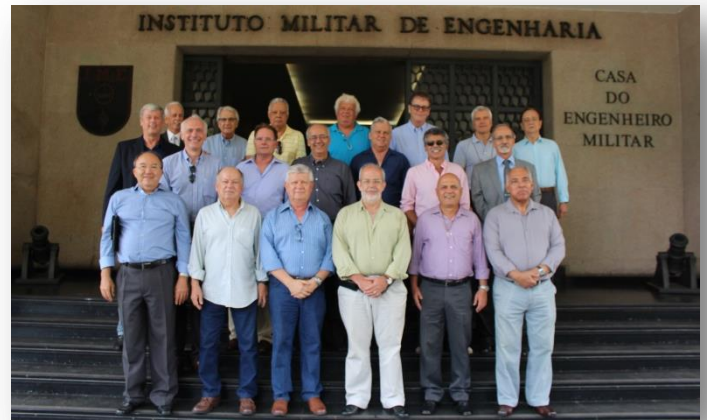
40 anos: confirmação dos mesmos ideais.