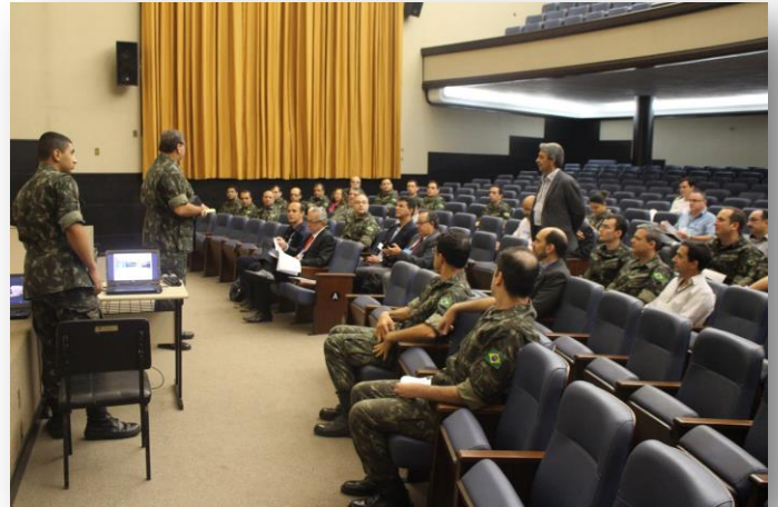
Integrar para unir esforços na mesma direção.

A Jornada do dia 01º de novembro abordou temas relacionados ao empreendedorismo, à inovação tecnológica, à propriedade intelectual, a projetos de fim de curso, de grande interesse dos participantes.