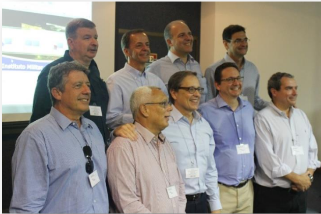
1981: 35 anos depois, o retorno às origens!...

É sempre uma alegria reencontrar os antigos Alunos e saber das histórias de sucesso, dentro e fora do Exército.