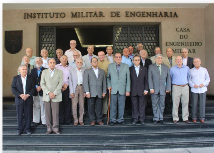
Em destaque (ao centro) estão o General Moniz de Aragão e o General Carvalho , que foram Comandantes do IME.