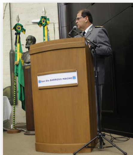
O Comandante do IME proferiu palavras de incentivo.