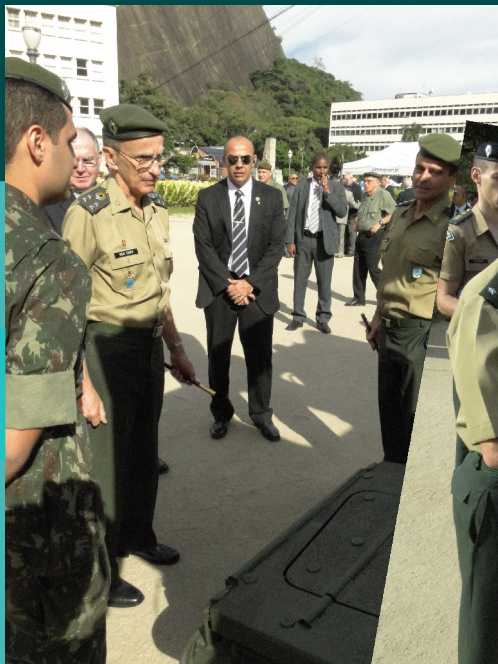
Exposição de material de emprego militar...