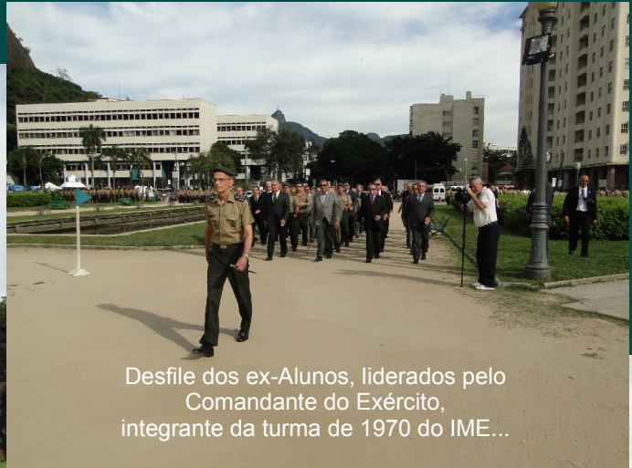
Desfile dos ex-Alunos, liderados pelo Comandante do Exército, integrante da turma de 1970 do IME...