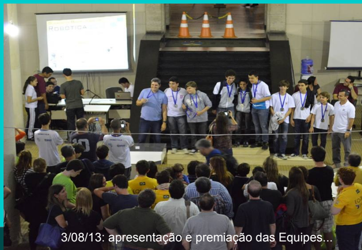
3/08/13: apresentação e premiação das Equipes...

Visite a página da OBR: www.obr.org.br .