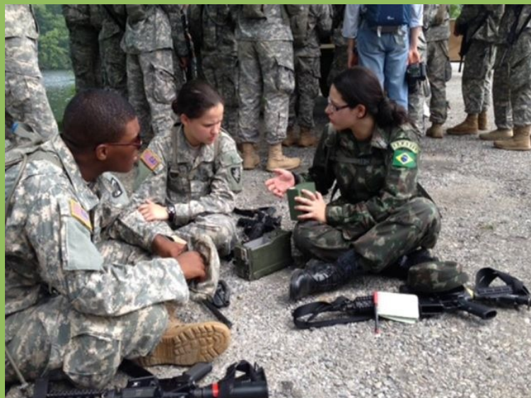
Aluna do IME em treinamento militar com Cadetes da Academia Militar de West Point

Concluído o estágio em West Point , esses jovens militares visitaram a Embaixada Brasileira, a Aditância Militar e a Comissão do Exército Brasileiro, em Washington, e a Missão Permanente do Brasil, junto à Organização das Nações Unidas (ONU), localizada em Nova Iorque.