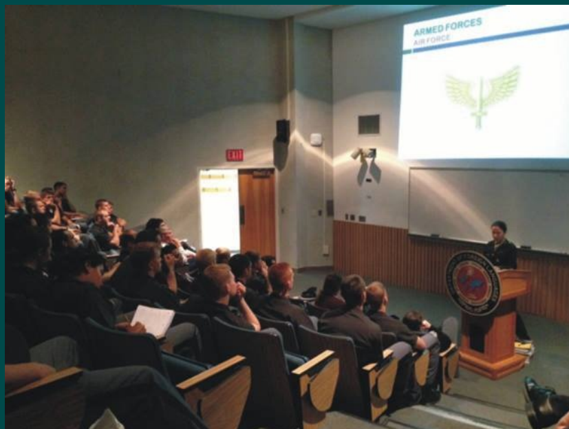
Alunos do IME apresentam e representam o Brasil: momento de orgulho e de emoção