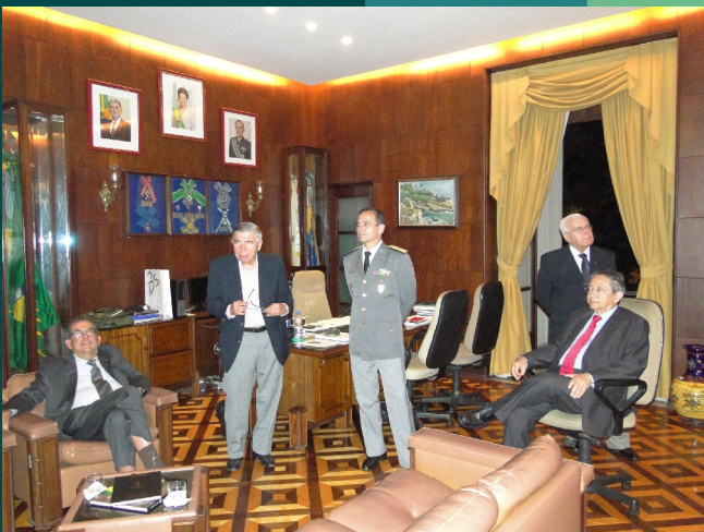
Reunião dos ex-Comandantes do IME...