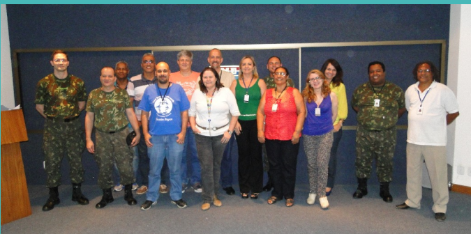
Primeira reunião do "Coral do IME"

O dia da primeira apresentação já é aguardado com grande expectativa sendo que, com certeza, será o início de uma carreira de sucesso.