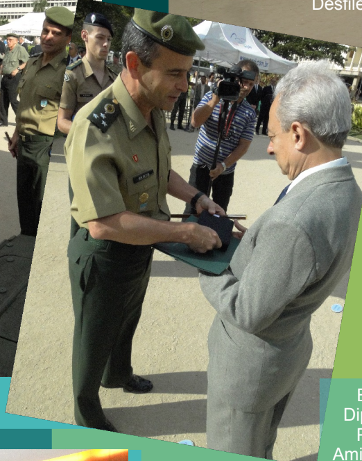
Entrega de Diplomas e de Placas aos Amigos do IME...