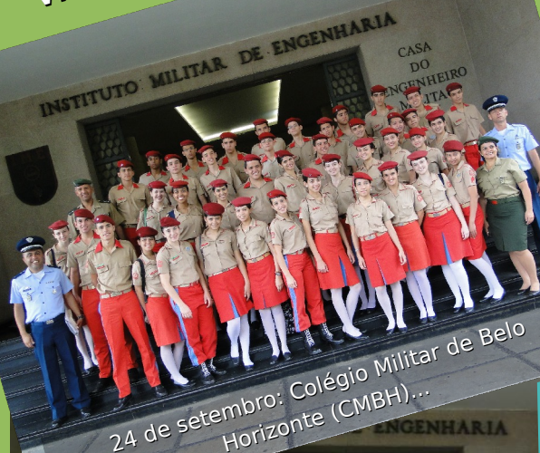
24 de setembro: Colégio Militar de Belo Horizonte (CMBH)...