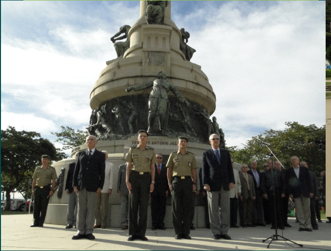
Formatura do IME, presidida pelo Comandante do Exército, com a presença de autoridades e de ilustres convidados...