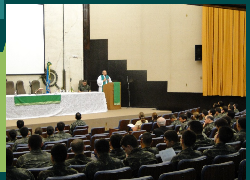
Atividades religiosas: católica, espírita e evangélica..