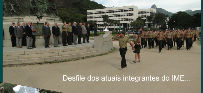
Desfile dos atuais integrantes do IME...