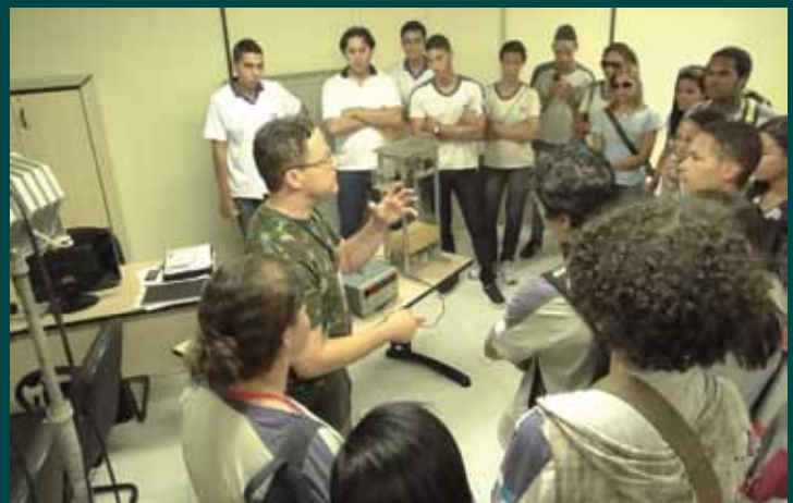
Explicação sobre os estudos acadêmicos desenvolvidos em laboratório