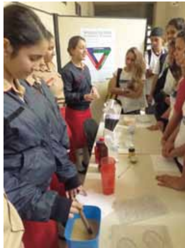
Alunas do CMRJ apresentaram seus trabalhos a estudantes da rede pública

Neste ano, alunos do Colégio Militar do Rio de Janeiro (CMRJ) apresentaram trabalhos especialmente desenvolvidos para a Feira. O EIC é outro evento no qual alunos bolsistas do IME, patrocinados pela CAPES ou pela Fundação Ricardo Franco, apresentam o resultado de suas pesquisas científicas, sob a orientação dos professores do Instituto.