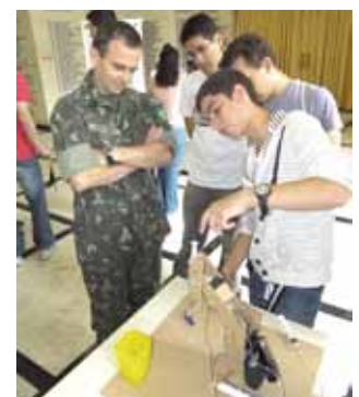
Os estudantes demonstraram conhecimento