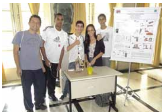
As equipes estavam unidas

O projeto Eureka é desenvolvido por alunos do IME, com apoio da Fundação Ricardo Franco (FRF), e tem por objetivo orientar estudantes da rede pública de ensino a apresentar trabalhos de cunho científico. Os resultados são compensadores, pois muitos participantes pensam em seguir uma carreira na área de C&T. Sejam bem-vindos!