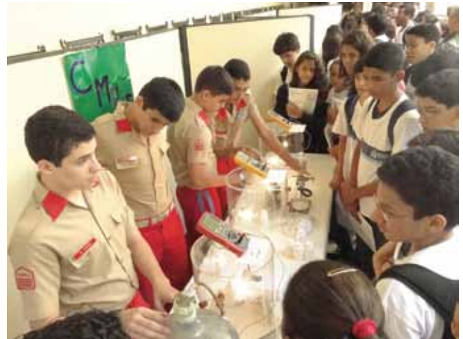
O interesse dos jovens pela C&T deve ser estimulado desde cedo