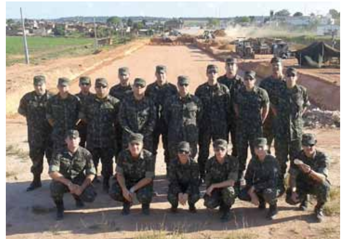
Alunos do IME em visita ao canteiro de obras

Realizada no período de 23 de outubro a 01º de novembro, foi uma oportunidade de aprimoramento profissional, sendo que os alunos conheceram as obras desenvolvidas nas seguintes cidades: Aracaju (SE), Paulo Afonso (BA), Floresta (PE), Cabrobó (PE), Salgueiro (PE), João Pessoa (PB), Alhandra (PE), Goiana (PE), Recife (PE), Natal (RN) e São Gonçalo do Amarante (RN).