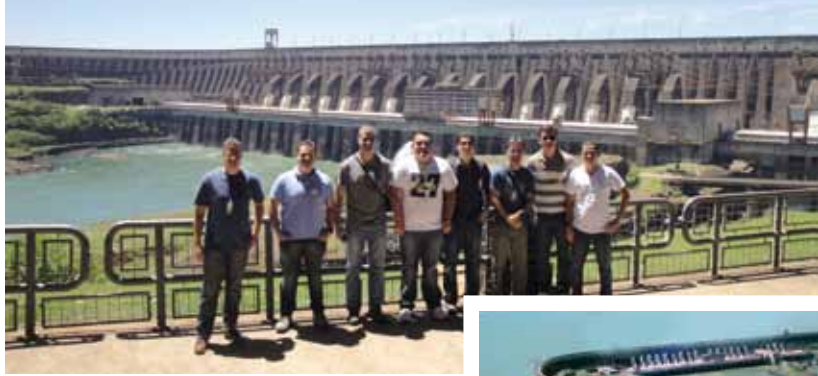
A visita complementou a formação dos futuros Engenheiros Militares

No período de 12 a 14 de novembro, os alunos do 5º ano do Curso de Engenharia Elétrica visitaram as instalações da Usina Hidrelétrica de Itaipu e da Subestação Conversora de Furnas, ambas localizadas na cidade de Foz do Iguaçu, no Paraná. Nessa oportunidade, os alunos conheceram os aspectos operacionais e a infraestrutura desses dois complexos.