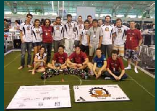
A união da equipe fez a diferença para garantir o resultado

A Fundação Ricardo Franco (FRF) patrocinou a participação do IME nesse evento.