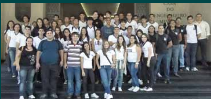
Alunos do Centro Educacional Imperial (CEI), de Magé (RJ), após a visita à Feira de Ciências e aos laboratórios