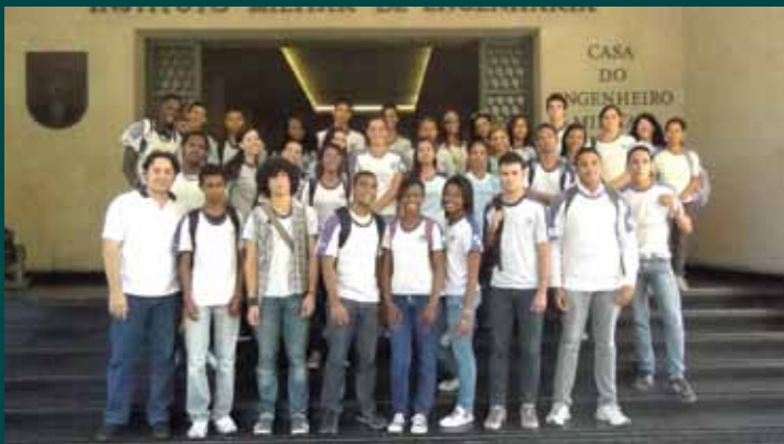
Alunos do CIEP 312 - Raul Ruff, do bairro Paciência, após a visita às instalações do IME