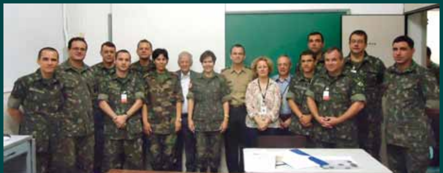
Comandante do IME, acompanhado dos professores e dos participantes, inclusive uma Oficial de Nação Amiga (ONA)

A Seção de Engenharia Nuclear (SE/7), do IME, realizou o Estágio Avançado de Proteção Radiológica, destinado a Oficiais médicos, dentistas, veterinários e farmacêuticos do Exército. Esse estágio teve a duração de 6 semanas e foi concluído no dia 9 de novembro.