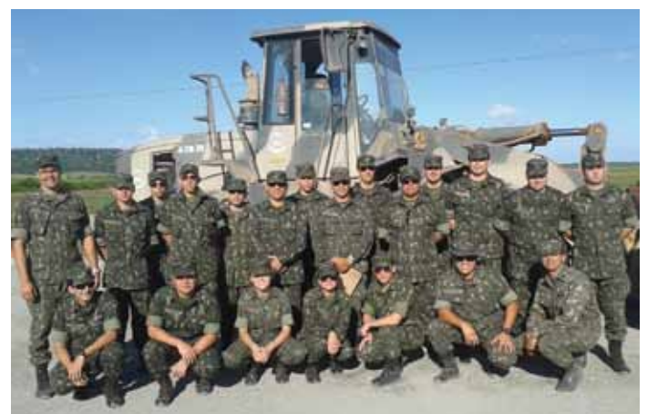
A Operação Lyra Tavares é uma experiência de grande importância profissional

Para informações, acesse http://rmct.ime.eb.br/index.html