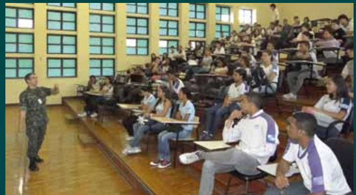
Palestra com informações sobre a história e os cursos oferecidos pelo IME