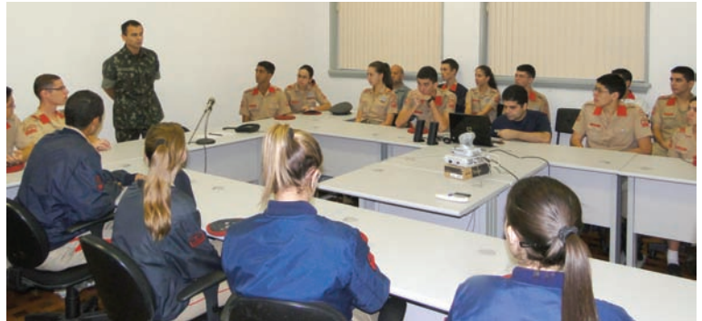
Visita do Colégio Militar do Rio de Janeiro