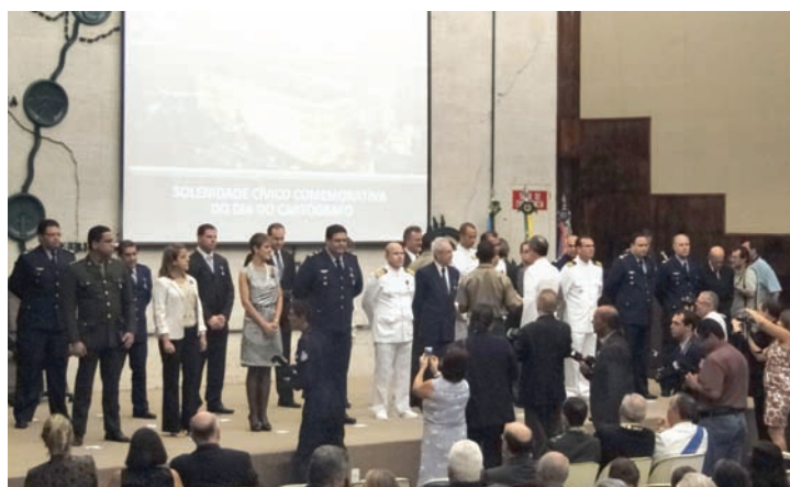
Entrega de Comendas aos Agradados

de entrega de Comendas a inúmeras personalidades. Diversas autoridades civis e militares prestigiaram o evento, dentre elas o Almirante de Esquadra Júlio Soares de Moura Neto, Comandante da Marinha. Após a cerimônia, realizada no auditório do IME, houve uma confraternização no Salão Nobre do Instituto.