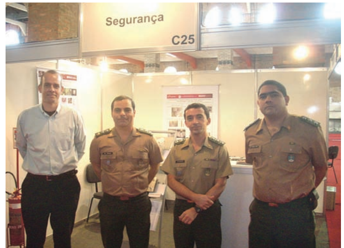
Equipe interdisciplinar do IME