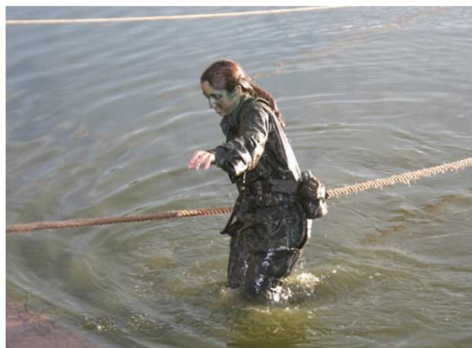
Transposição de curso d'água