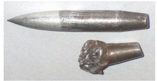
Blindagem sob impacto da munição 0.50

Comparação dos efeitos provocados no projétil 0.50 pol, antes e depois do impacto na blindagem cerâmica