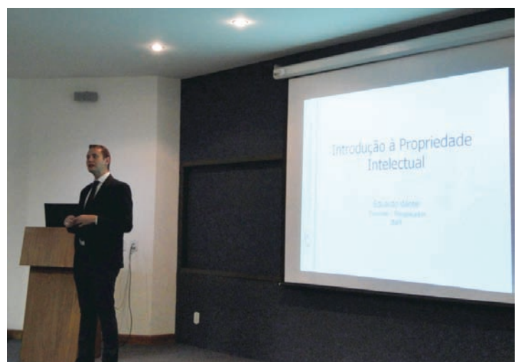
O evento intensificou a troca de informações