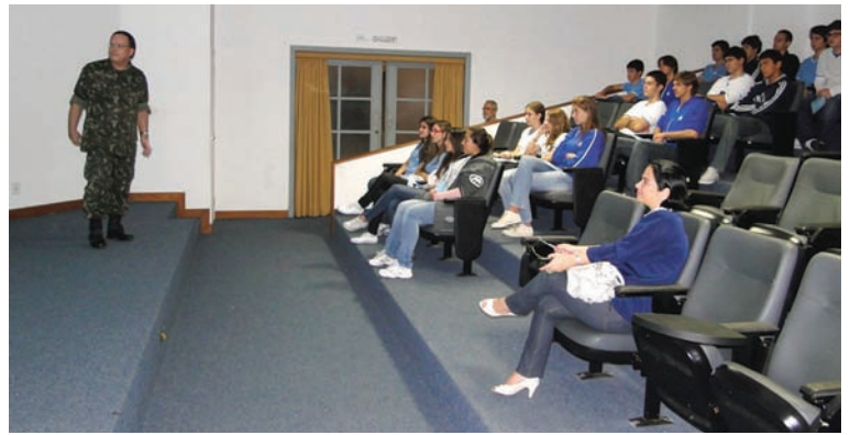
Visita do Curso PH

Nesse curto contato, os visitantes têm a oportunidade de comprovar como a Engenharia pode transformar a vida das pessoas para melhor.