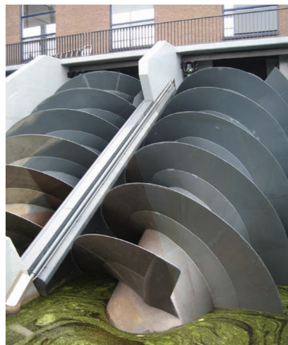
Parafusos de Arquimedes modernos que substituíram alguns dos moinhos de vento usados para drenar os polders em Kinderdijk, na Holanda.