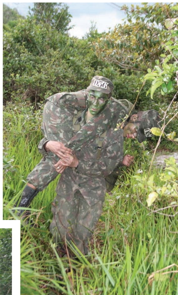
Transporte de feridos (HPPS)