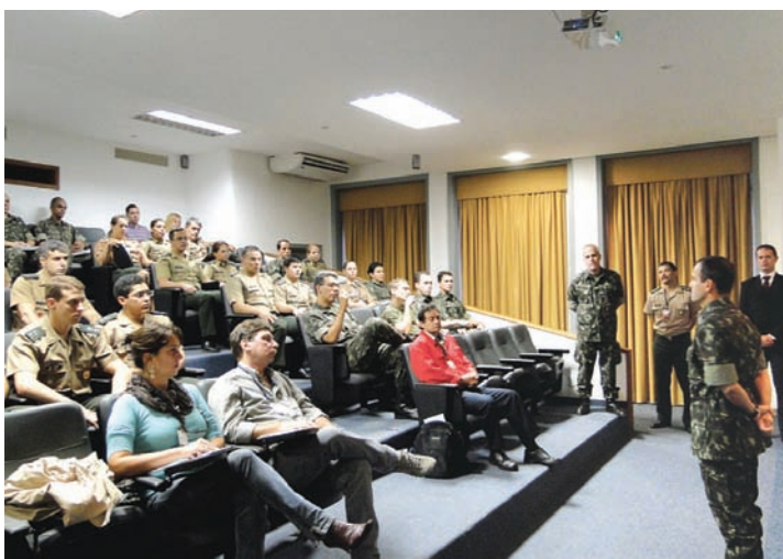
Abertura do evento pelo Comandante do IME

Essa é uma importante iniciativa para a disseminação da cultura de Propriedade Intelectual no âmbito da Força Terrestre.