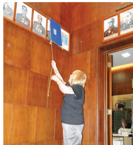
Inauguração de retrato na galeria de ex-comandantes

Após a inauguração do retrato do Comandante sucedido, ocorreu a formatura de Passagem de Comando do IME, presidida pelo General de Exército Augusto Heleno, então Chefe do Departamento de Ciência e Tecnologia. A cerimônia transcorreu em frente à Praça General Tibúrcio, na Praia Vermelha, com a vibrante participação dos integrantes do IME.