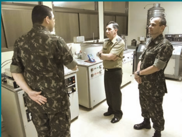
Chefe do DCT acompanhado do Cmt do IME