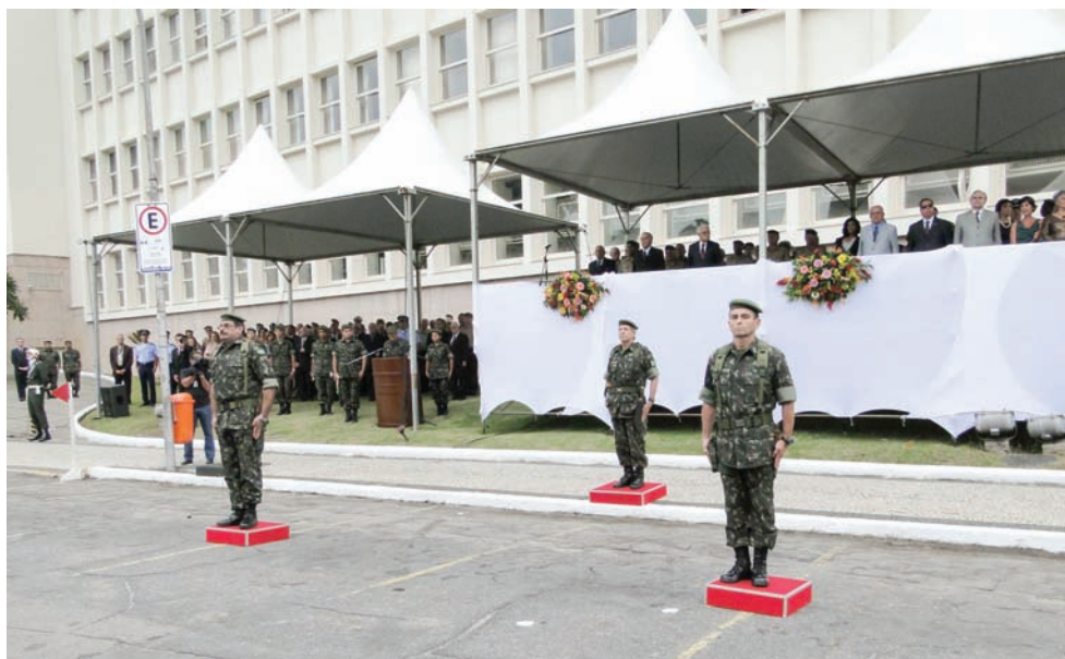
Passagem de Comando